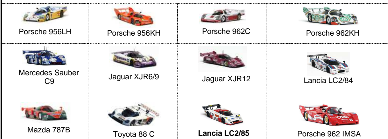
Tabella dei modelli omologati

0.2 Qualsiasi modifica, sostituzione o omissione può essere effettuata solo se esplicitamente richiamata da questo regolamento. Talvolta, per chiarezza, i divieti sono ribaditi esplicitamente.