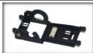
CH40 – Offset 0

2.2.3. Supporto motore sidewinder, offset=0 SICH40 (senza vincoli sul diametro delle ruote), o alternativamente offset=0.5 CH44 se usato con ruote di diametro medio (16.5mm) PA43 o alto (17.3mm) PA18/PA19, o offset=1.0 CH45 se usato con ruote di diametro alto (17.3mm) PA18/PA19. Si ammettono anche, con le stesse norme i vecchi supporti motore offset=0 e offset=1 dai quali è ammessa la rimozione dei segni degli estrattori, anteriormente e posteriormente ai quattro cilindri di fissaggio delle viti.