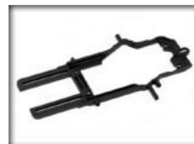
HRS2 - AW