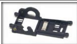
CH44 – Offset 0.5