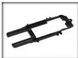
HRS2 - SW

HRS2 Slot.it, configurazione 'sidewinder' con supporto motore per corone con diametro 18mm: