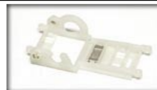
CH45 – Offset 1.0