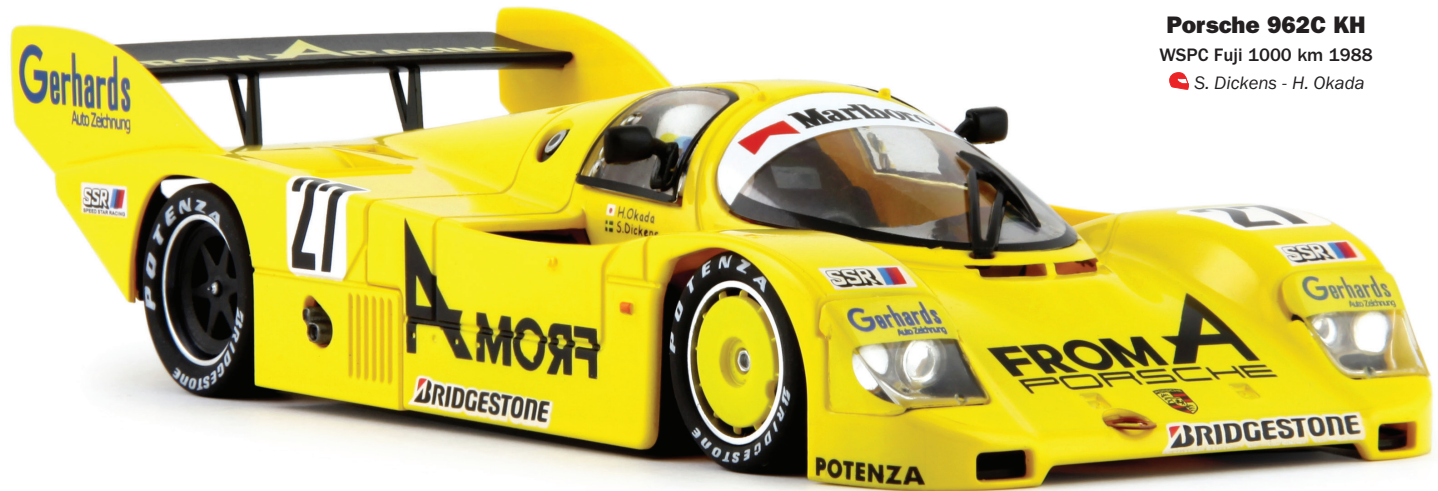
Porsche 962C KH WSPC Fuji 1000 km 1988 S. Dickens - H. Okada

Offset 0.5 motor mount 16,5 mm rear wheels