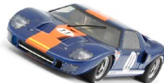
Ford GT40 - Ford MKII