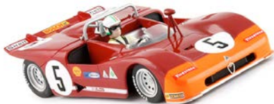
Alfa Romeo 33/3