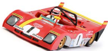
Ferrari 312 PB