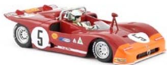
Alfa Romeo 33/3